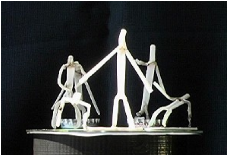
"Vom besseren Leben" aus: Früchte der Langeweile (D 2004/2005)