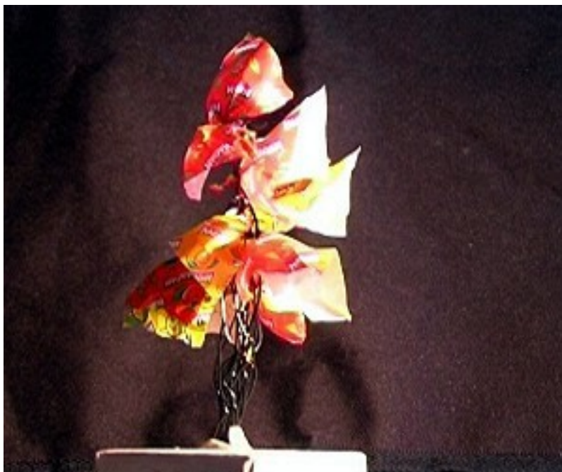
"Falsches Idyll" aus: Früchte der Langeweile (D 2004/2005)